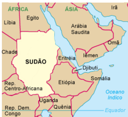
Mapa do Sudão

O Sudão é um país rico em petróleo, gás natural, ouro, prata, cromo, asbesto, manganês, gipsita, mica, zinco, ferro, chumbo, urânio, cobre, cobalto, granito, níquel e alumínio. Estes fatores sinalizam a potência regional que poderia despontar, com poder e influência, permitindo um determinado controle sobre a região geográfica em que ele está inserido.